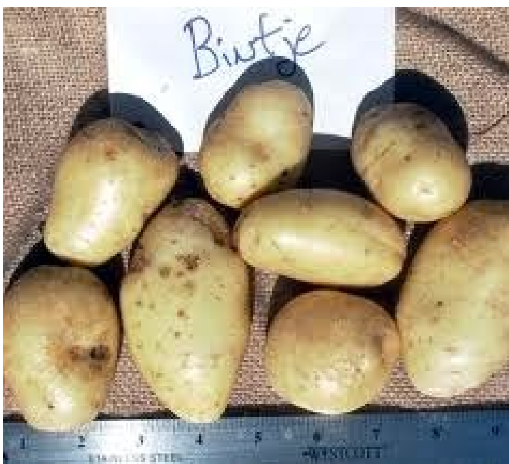
"Patate da seme" Bintje pronte per la semina nei mesi di marzo ed aprile.

Nel periodo da febbraio ad aprile i lavori dell'orto biologico saranno descritti mese per mese. In questo periodo si concentrano molti importanti lavori influenzati dalla variazione del clima.