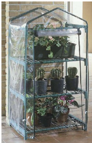
Serra a tre ripiani

Queste serre hanno più ripiani e possono ospitare un numero elevato di piantine.