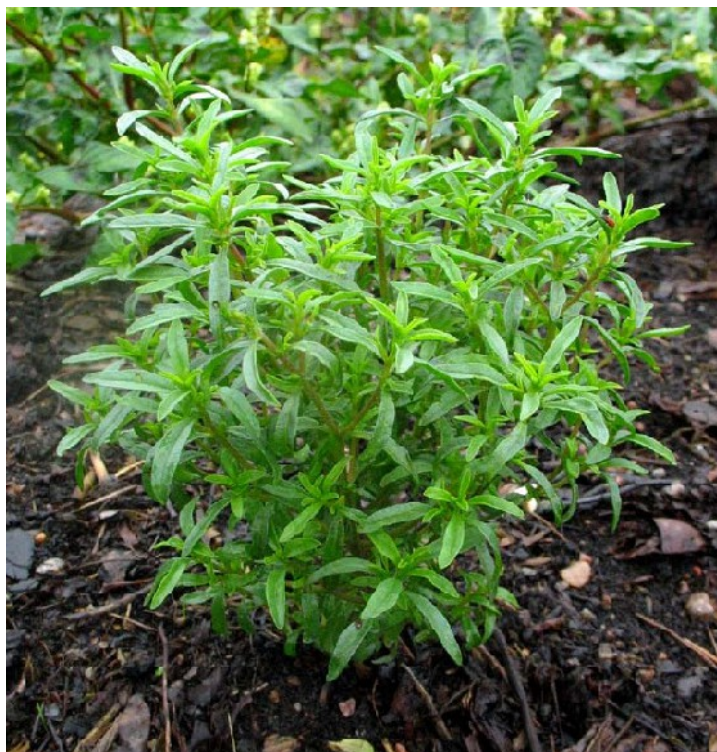
Santoreggia o Erba Cerea (Satureja Ortensis)

L'irrigazione automatica delle piante aromatiche si effettua con collana gocciolante, disponendo un gocciolatore al piede di ogni pianta. La collana gocciolante è descritta nella pubblicazione "L'irrigazione dell'Orto" .