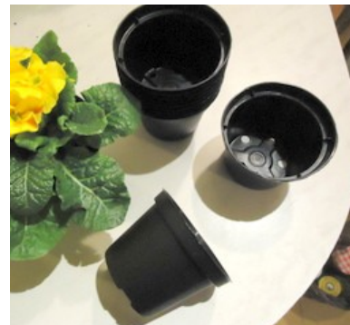
Vaso nero di plastica

Per la semina dei pomodori dei peperoni, delle melanzane e degli zucchini utilizzeremo il Jiffi , per la semina del basilico e del prezzemolo utilizzeremo il vasetto di plastica da 10 cm . La semina nel Jiffi consente di seminare un solo seme per ogni dischetto ed è adatta ad ortaggi che si trapiantano singolarmente su fila come i pomodori, le melanzane, i peperoni, gli zucchini o che hanno semi costosi come nel caso delle varietà di ortaggi ibridi.