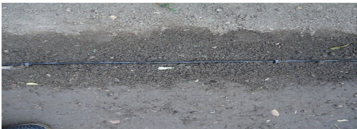
Il tubo gocciolante Minidrip irriga una semina di patate .

Per l'irrigazione di dispone lungo la fila un tubo gocciolante da 16 mm. di diametro o meglio un tubo Minidrip da 6 mm. di diametro con passo fra i gocciolatori 15 cm. Il tubo Minidrip deve essere fissato al terreno con le apposite astine identiche a quelle utilizzate per fissare i gocciolatori.