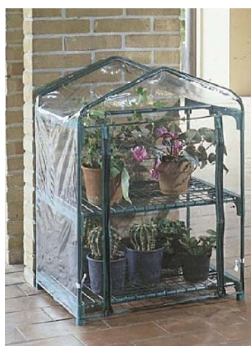
Serra a due ripiani