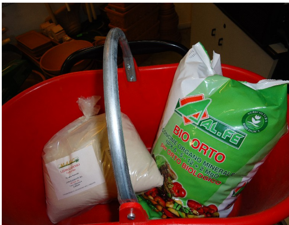
I prodotti necessari a preparare il Cocktail Maiac nella cesta di plastica.